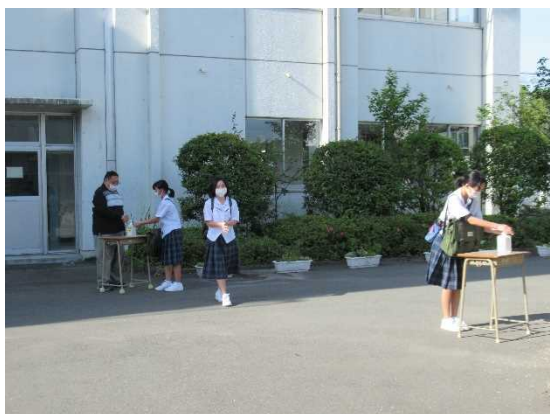
【校舎に入る前にも消毒】