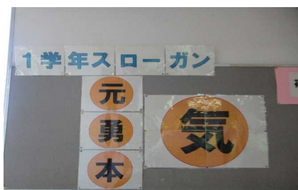
【1年生廊下の掲示物】