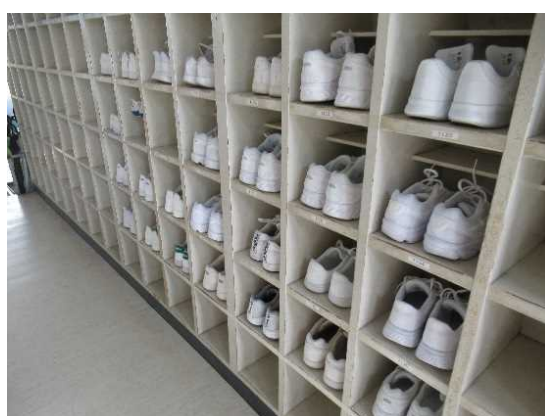
【きれいに並べられた真っ白なスニーカー】