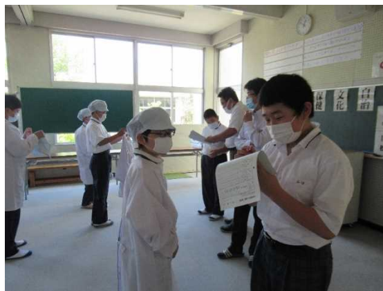
【給食委員による点検】