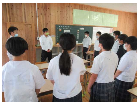
【掃除の始めは黙想，終わりは反省会】