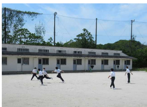
【元気に走り回る1年生】