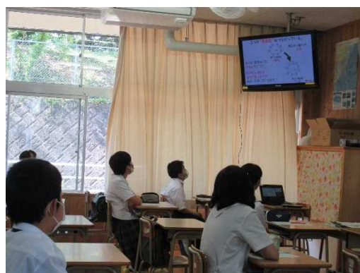
【真剣に画面を見て学ぶ1年生】