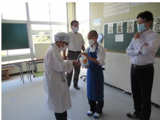
【保健委員による消毒】