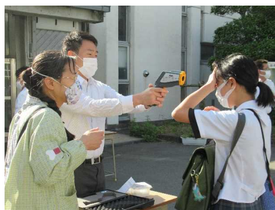
【検温をしていない人は検温】