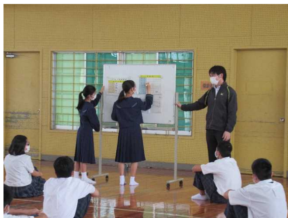
【積極的に委員に立候補】