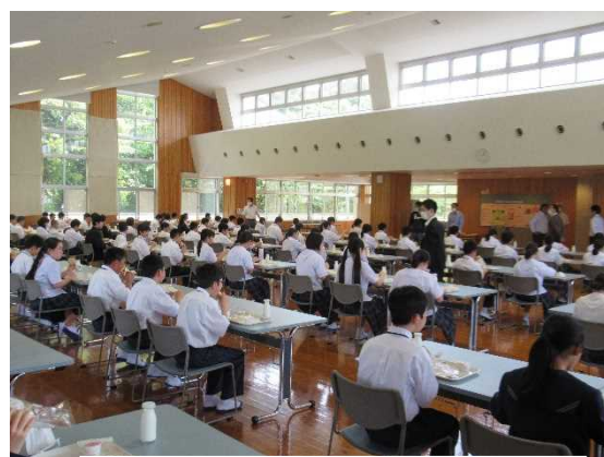
【一方向を向いて静かに食事】