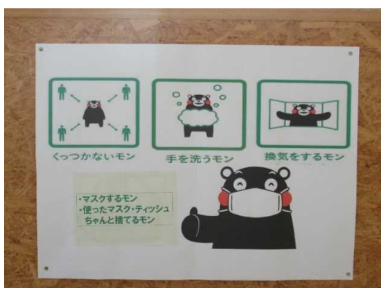
【三密・手洗い・喚起に注意して】