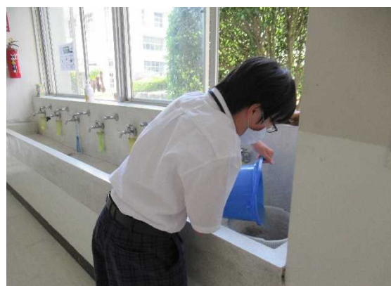
【最後まで丁寧に片付け】