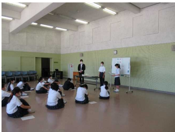
【新自治委員による進行】