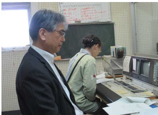
【放送による心のサポート授業】